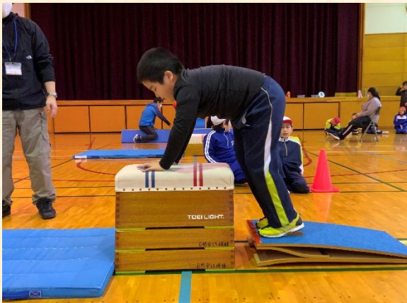
体育「跳び箱をしよう」：ロイター板で3回ジャンプをしてから跳ぶ練習をしました。