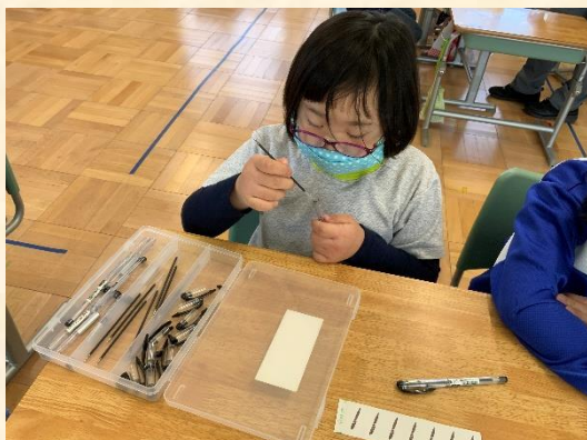
自立活動：ボールペンの組み立てをしました。