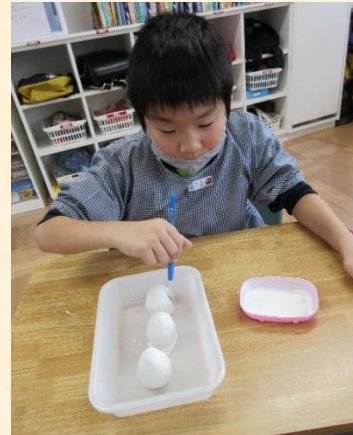
生活単元学習「石岡市について知ろう」：石岡市の特産品について調べ、紙粘土で卵を作りました。