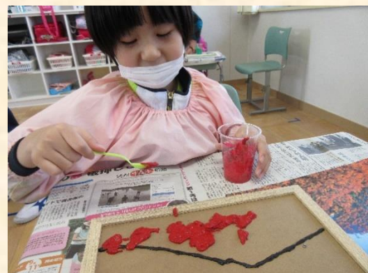
図画工作「筑波山を描こう」：筑波山の砂絵を作りました。