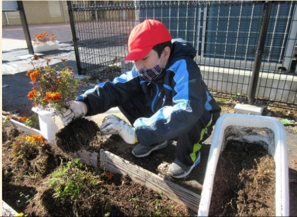
道徳「花いっぱい運動」：花壇やプランターのマリーゴールドの片付けを行いました。

新型コロナウイルス感染拡大の影響で授業参観が中止になってしまいました。子どもたちの頑張っている様子を直接見てもらいたかったのですが・・・残念です。代わりにホームページの写真をこまめにアップしていきたいと思えます。では小学部4年生の11月の学習の様子をお伝えします。