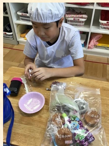
小4特別活動「非常食体験」：防災リュックの非常食を試食しています。