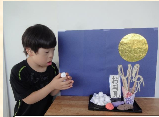
小4図画工作「お月見かざりをつくろう」：自分で作ったお団子を見てうっとり。