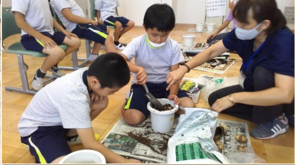
小3生活単元学習「そだててみよう」：ミニすいせん、サフランの球根を植える準備をしました。