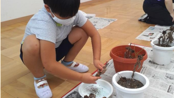
小3生活単元学習「そだててみよう」：育てたミニひまわりの種とりをしました。

朝夕の風が秋の気配を感じさせてくれる季節になってきました。勉強、運動・・・何をするにもいい季節ですね。8・9月の小学部3・4年生の学習の様子をお伝えします。