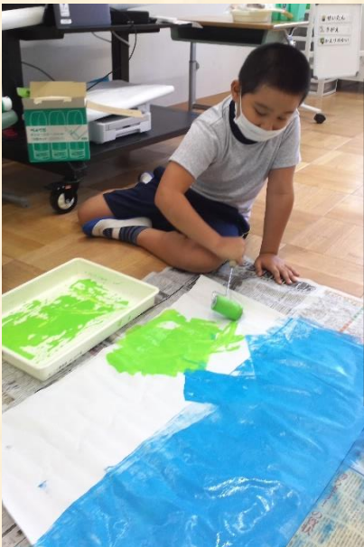
小3図画工作「ぬってきってはろう」：空とお花畑の色をローラーで塗りました。