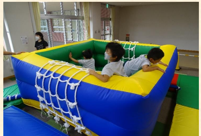
〈エアトランポリン〉