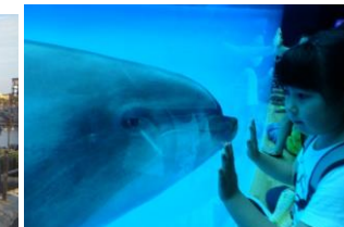
遠足（アクアワールド）