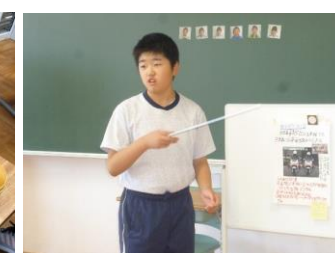
生活単元学習「働く人」