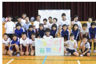
小幡小学校との交流