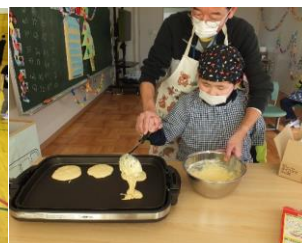
生活単元学習「お楽しみ会」