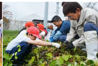
地域交流（さつまいも掘り）