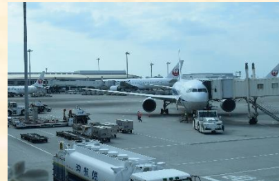
(4日目の様子 おきみゅー・那覇空港)