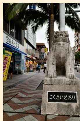
(1日目の様子 羽田空港・飛行機・国際通り)

天候に恵まれ、沖縄の美しい海や自然を見ることができました。ひめゆりの塔では平和への祈りを捧げ、おきなわワールドでは鍾乳洞や沖縄文化を堪能できました。