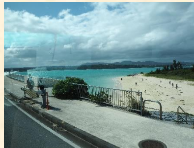
(3日目の様子 パイナップルパーク・古宇利島・美ら海水族館)

ソーキそばやタコライス，サーターアンダーギー等の沖縄グルメも満喫しました。学年の絆も深まり，思い出に残る素晴らしい修学旅行になりました。