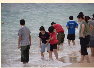
(2日目の様子 ひめゆりの塔・玉泉洞・おきなわワールド グラスボート・ホテル前のビーチ)