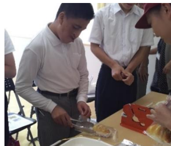
パンの袋詰め体験