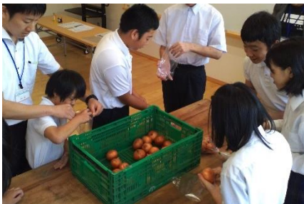
玉ねぎの袋詰め体験