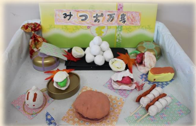
(3年 お店屋さん<紙粘土による立体作品>)