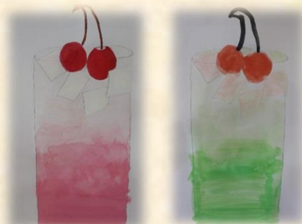
(2年 クリームソーダ<ほかし絵画>)