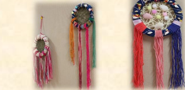
(1年 ドリームキャッチャー<立体作品>)