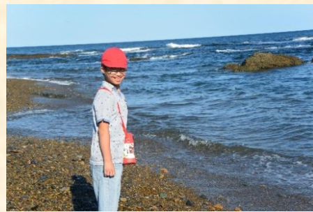
(海を背景にハイチーズ！)