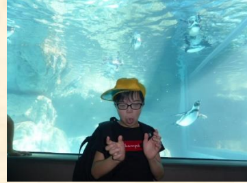
(ペンギンと一緒に)