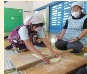
(全てみんなで作りました。美味しいうどんが出来上がりました！)