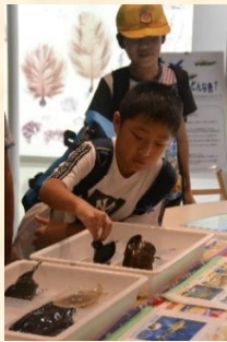
(サメのたまごを触ったよ！)