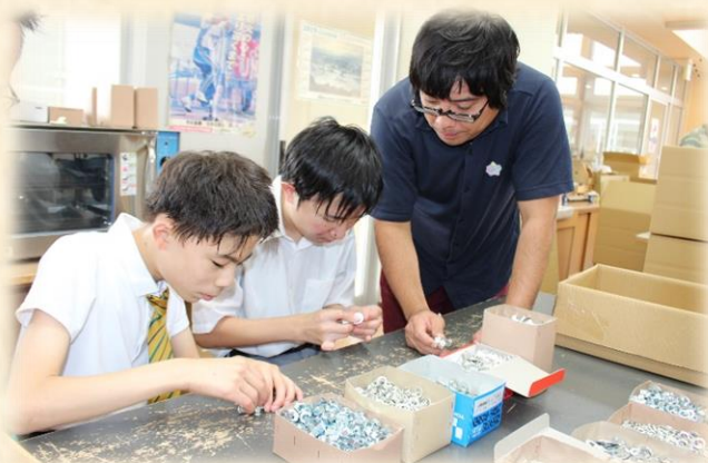
(ねじ回し体験。難しくても頑張りました。)