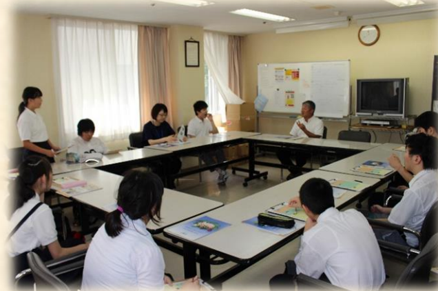
(質疑応答の様子です。たくさん質問しました。)