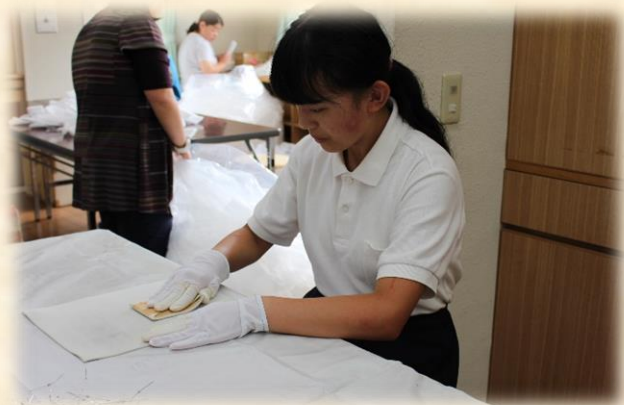
(リード線伸ばし。丁寧さが大切です。)