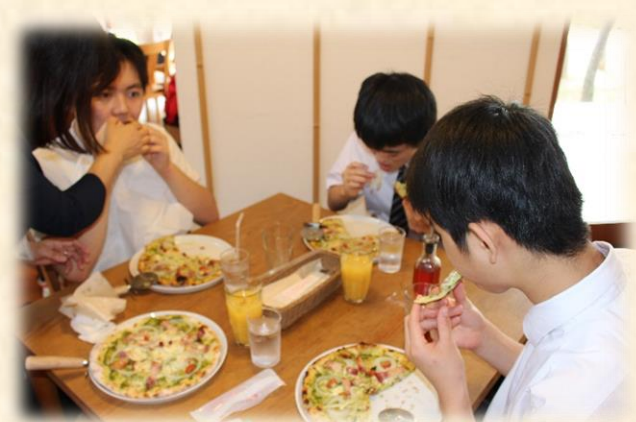
(昼食の様子。みな笑顔で満足そうでした。)