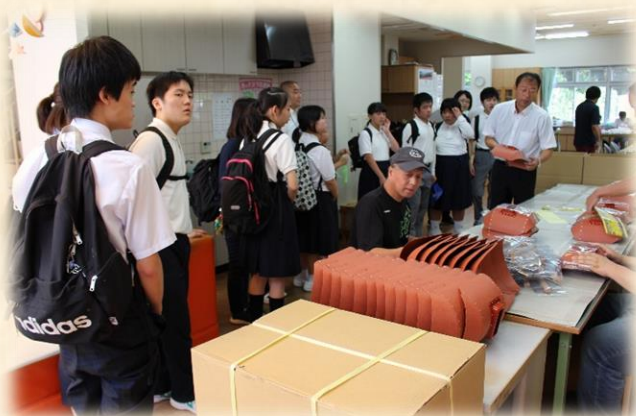
(見学の様子です。みな真剣です。)

9月24日(火), 中学部3年生が職場見学・体験の学習として、「社会福祉法人白銀会」の系列である, 銀の笛, しろがね苑, トラットリア・アグレステへ校外学習に行ってきました。銀の笛では, ねじ回し, フルーツキャップ折り, リード線伸ばしの体験を行い, しろがね苑では, 実際の居住の様子の見学, トラットリアでは, 利用者の方の接客を受けながらの昼食をとってきました。「ルールを守って生活すること」, 「一緒に働く仲間のつながりの大切さ」などの話があり, 生徒たちは熱心に話を聞きながらメモを取ったり, 質問をしたりと, これからの高等部・社会へ向けての良い体験となりました。