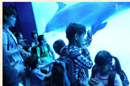
(みんなイルカに夢中です)