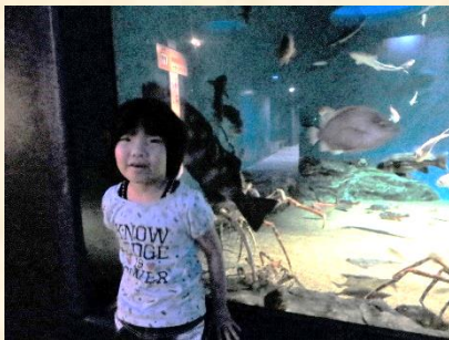
(深海にはカニもいます)