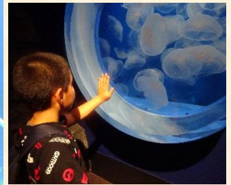
(クラゲがいっぱい)