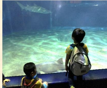
(サメの水槽の前で)