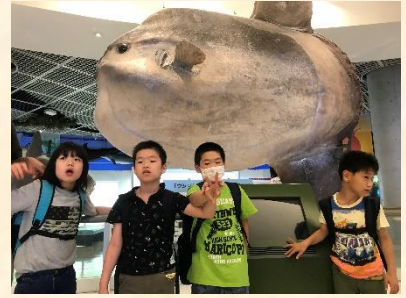
(巨大なマンボウと)