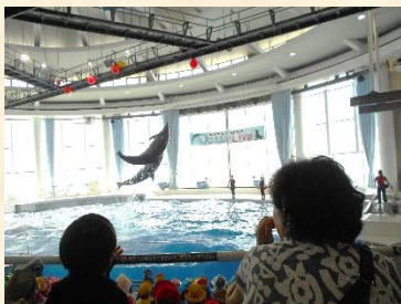
(イルカのジャンプ!)