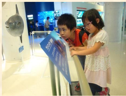
(展示物をじっと見えます!)