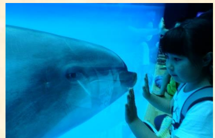
(会いに来てくれました!)