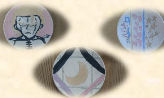
（生徒の作品お皿の絵付け）