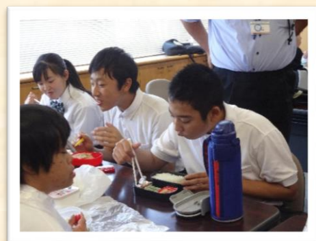
（おいしい昼食タイム）