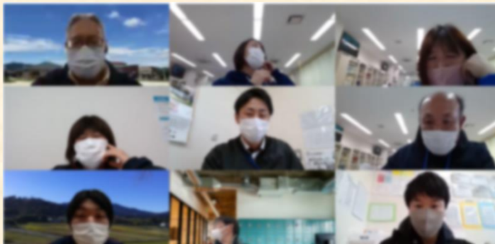
オンラインでの研修の様子