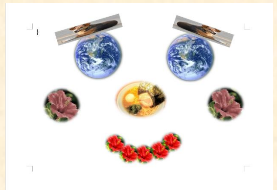
実技研修 デジタルコラージュ「顔」