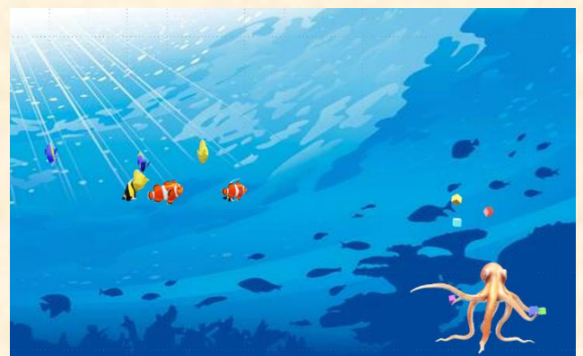
実技研修 3D オブジェクトによるデジタル作品「読書」 / 「海」(魚とタコは動きます)