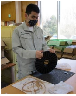
円盤のシールはがし