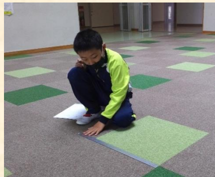
算数「長さ」:定規を使って、ふれあい広場のマットの大きさを測りました。