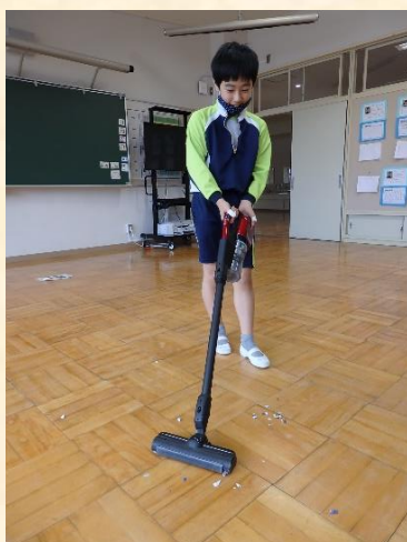
生活単元学習「わたしたちのくらし（掃除）」:掃除機を実際に操作して、使い方を学習しました。