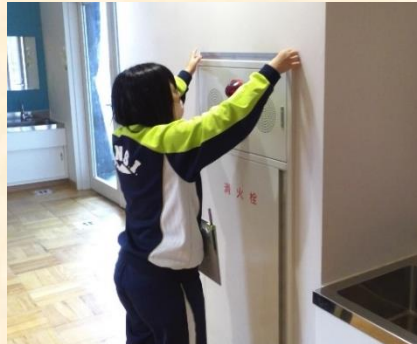
算数「長さ」:定規を使って、学校内のいろいろな物の長さを測りました。