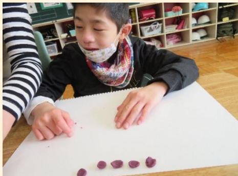
図画工作「夢の国（お城を作ろう）」:指先で粘土をこね、お城につける飾りを作成しました。

新型コロナウイルス感染拡大の影響で授業参観が中止になってしまいました。子どもたちの頑張っている様子を直接見てもらいたかったのですが・・・残念です。代わりにホームページの写真をこまめにアップしていきたいと思えます。では小学部6年生の11月の学習の様子をお伝えします。