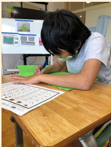
図画工作「夢の国（お城を作ろう）」:カッターを使って、お城の窓になる部分を切り抜きました。