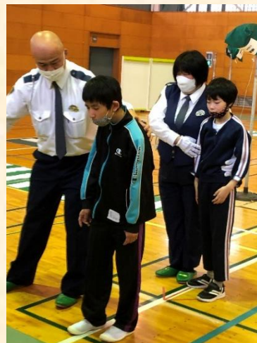
「交通安全教室」:石岡警察署の方と道路の渡り方について学習しました。