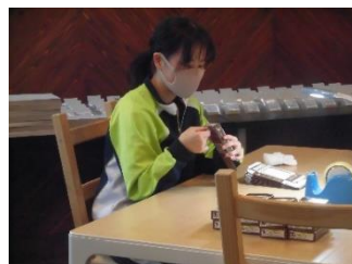
ランプの箱の組み立て