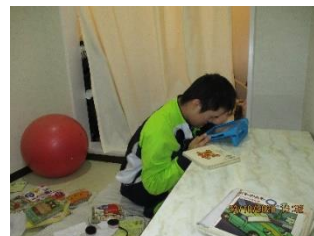
レクリエーション活動