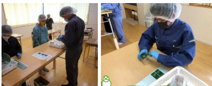
オフィスワークスA班