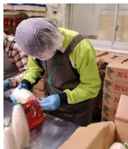
大根のカット, 袋詰め