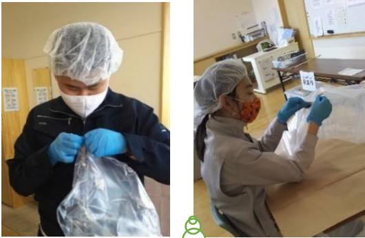
コラボカンパニー班