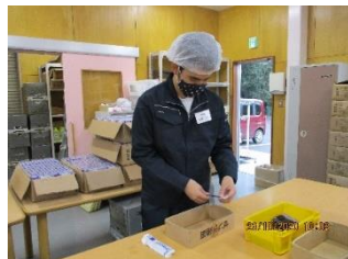
ボールペンの袋詰め