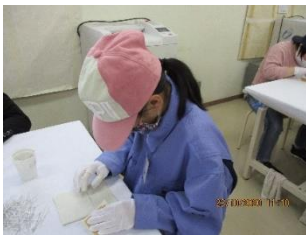
リード線伸ばし作業